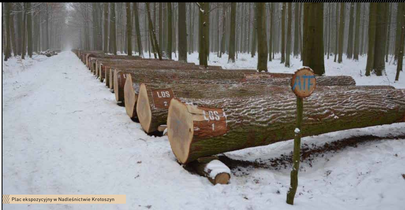
Plac ekspozycyjny w Nadleśnictwie Krotoszyn